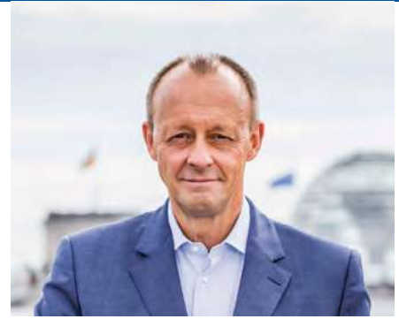
Schwerpunkt An den Wohlstand von morgen denken – in Deutschland und Europa » Seite 6