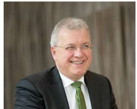
Schwerpunkt Interview mit Markus Ferber MdEP » Seite 8